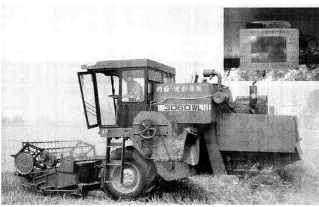
本版编辑 牟玉娟 本版校对 丁建军

据新华社华盛顿6月18日电(记者 胡晓明 谭新木)美国国防部导弹防御署发言人莱纳18日说,美军当天进行的一次海基导弹防御系统拦截试验失败。