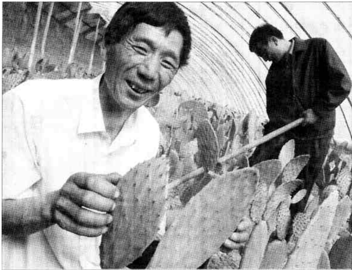
在成功开发黄河三角洲滩涂的同时,不断拓宽开发领域,在科技园内种植引进的墨西哥食用仙人掌又取得了成功。

众所周知,经济活力的增强,取决于市场化程度的提高。因此,面对不足,我们一定要转变思维方式,坚持用改革的办法解决前进中的问题,坚持用市场经济的手段抓经济工作,坚持用创新的精神培植发展新优势,用市场这只无形手去破解难题,创新体制机制,不断提高驾驭市场经济的能力,促进全市经济实现超常规、跨越式发展。